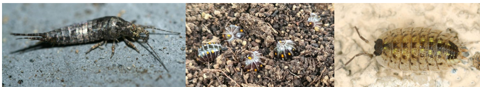
Abb. 32: Lepismachilis notata , Glomeris pustulata und Porcellio spinicornis (v.l.n.r.).

Leider ist unser Kenntnisstand in Österreich zu Verbreitung und Vorkommen bei vielen Organismengruppen sehr lückenhaft. Dies gilt insbesondere für viele Gruppen von Bodenarthropoden, insbesondere für primär flügellose Insekten und Myriapoden. Während Österreich in der ersten Hälfte des 20. Jahrhunderts noch zu den Hochburgen der Myriapodenforschung (STAGL 2003) zählte, fehlen Daten zur rezenten Verbreitung der meisten Arten weitgehend. Im Rahmen des Insektencamps konnten 2 Myriapoden-, 3 Landassel- und 2 Archaeognathenarten sowie eine Collembolenart dokumentiert werden. Dabei ist die Felsenspringerart Lepismachilis notata sehr erwähnenswert.