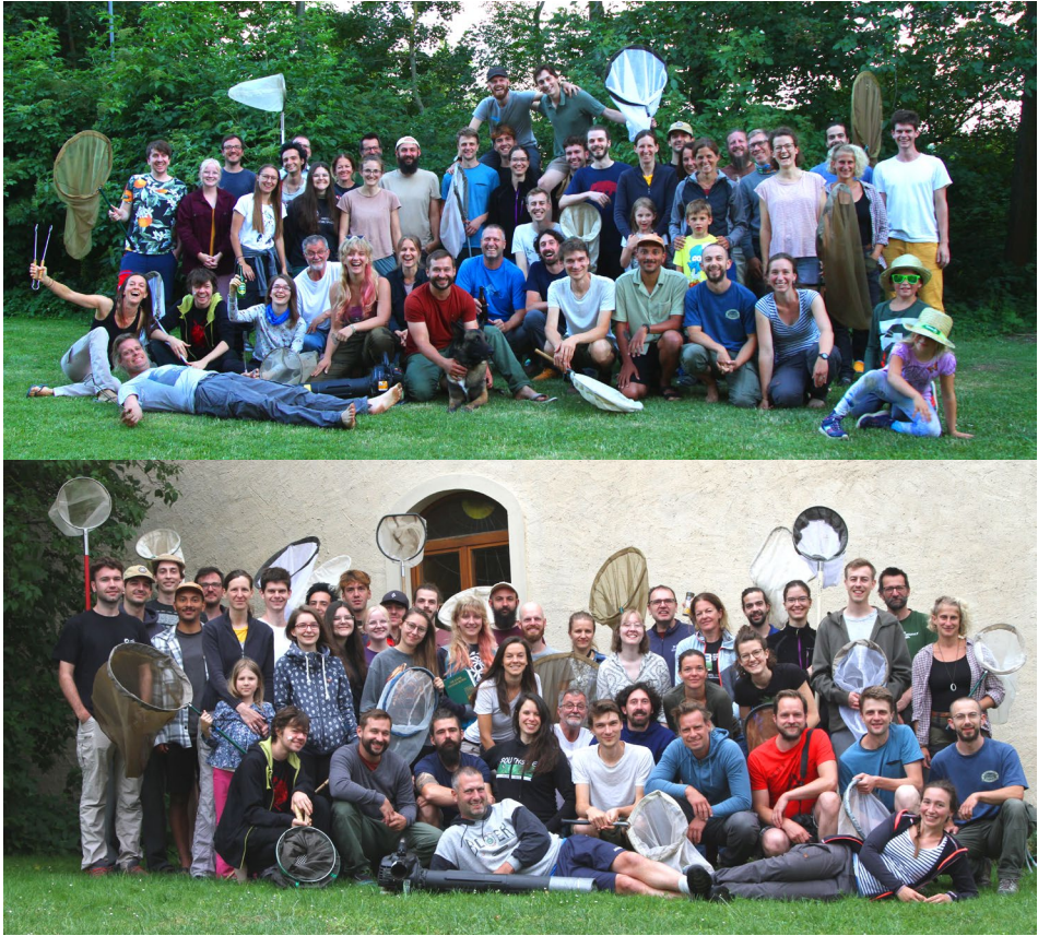
Abb. 1: Gruppenfotos der Mitwirkenden vor Ort beim achten ÖEG-Insektencamp im Naturpark Leiser Berge, Oberleis.

An den vier Exkursionstagen im Naturpark Leiser Berge nahmen 46 WissenschaftlerInnen und Studierende teil. Die vorliegende Arbeit leistet einen wichtigen Beitrag zur Datenerfassung der wenig bekannten Vielfalt der Insekten-, Spinnen-, und Weichtierfauna dieser speziellen Region.