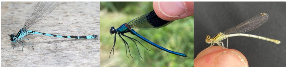
Abb. 14: Coenagrion ornatum , Calopteryx splendens , Platycnemis pennipes (v.l.n.r.).

Tab.3: Nachgewiesene Odonata (Libellen) im Naturpark Leiser Berge mit Angabe der Rote Liste-Kategorien, wenn vorhanden, und der Gesamtindividuenzahl. Rote Liste-Kategorien: DD/6 = Datenlage ungenügend, 5 = Gefährdungsgrad nicht genau bekannt, LC = ungefährdet, NT/V/4 = nahezu gefährdet (Vorwarnstufe), G = Gefährdung anzunehmen, VU/3 = gefährdet, EN/2 = stark gefährdet, R = extrem selten, CR/1 = vom Aussterben bedroht (RAAB & CHWALA 1997, RAAB et al. 2007).