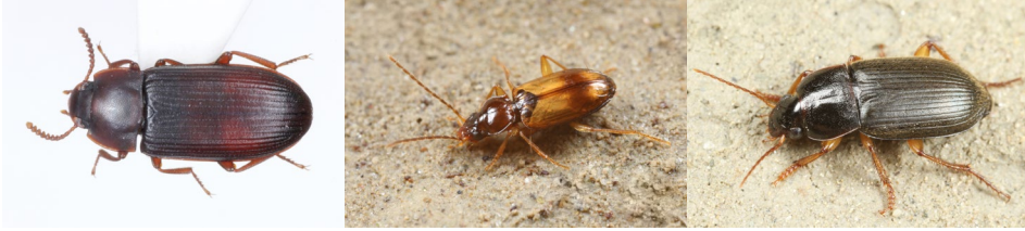
Abb. 31: Cynaenus angustus , Tachys fulvicollis und Parophonus hirsutulus (v.l.n.r.).

sind (GEIS 1995), wurde auf einer Waldweide (PF17) dokumentiert. Der wärmeliebende Kapuzenkäfer Lichenophanes varius , ein Besiedler abgestorbener Buchen und Eichen, kommt an mehreren Stellen im Gebiet vor (PF9, PF17, PF25).