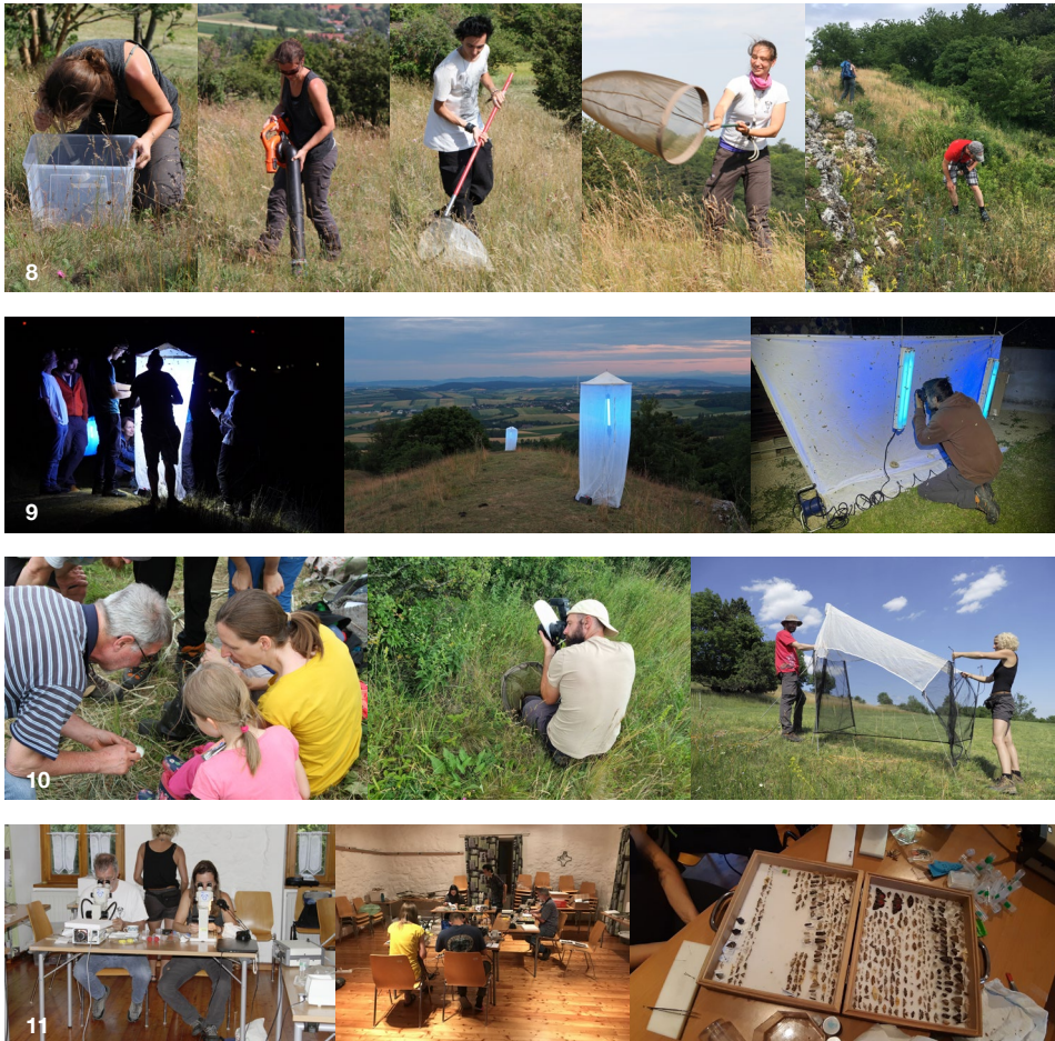
Abb. 8: Verschiedenste Sammelmethoden, wie Insektensauger, Landkescher und Handfang. Fotos: L.W. Gunczy, E. Huber & E. Papenberg. Abb. 9: Kontrolle der Leuchttürme in der Dämmerung und der Nacht und Fotodokumentation der Arten. Fotos: P. Schattanek-Wiesmair, M. Sonnleitner & G. Kunz. Abb. 10: Analyse & Erklärung des Tiermaterials, Fotodokumentation, Aufbau der Malaisefalle, Fotos: E. Huber & M. Sonnleitner. Abb. 11: Determination und Präparation des gesammelten Materials. Fotos: E. Huber & M. Denner.