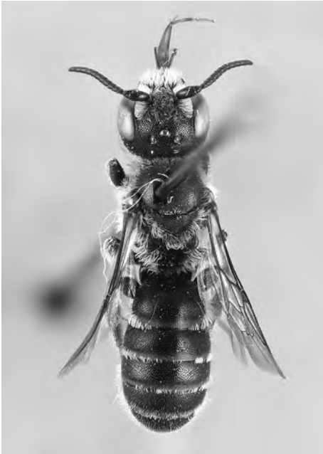
Abb. 2: Osmia mazzucchi SCHWARZ & GUSENLEITNER 2005 wurde K.M. als Anerkennung für seine Forschungen zur Apidologie in Österreich gewidmet.

tional Institute for Applied Systems Analysis) in Laxenburg als Evolutionsbiologe tätig, ein kongenialer Partner.