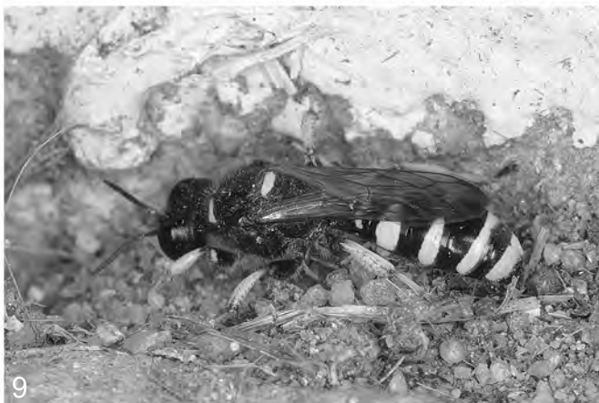
Abb. 7-9: (7) Auplopus carbonarius (SCOPOLI) (Pompilidae); (8) Vespula germanica (FABRICIUS) (Vespidae); (9) Crabro cribrarius (LINNAEUS) (Sphecidae s.l.).