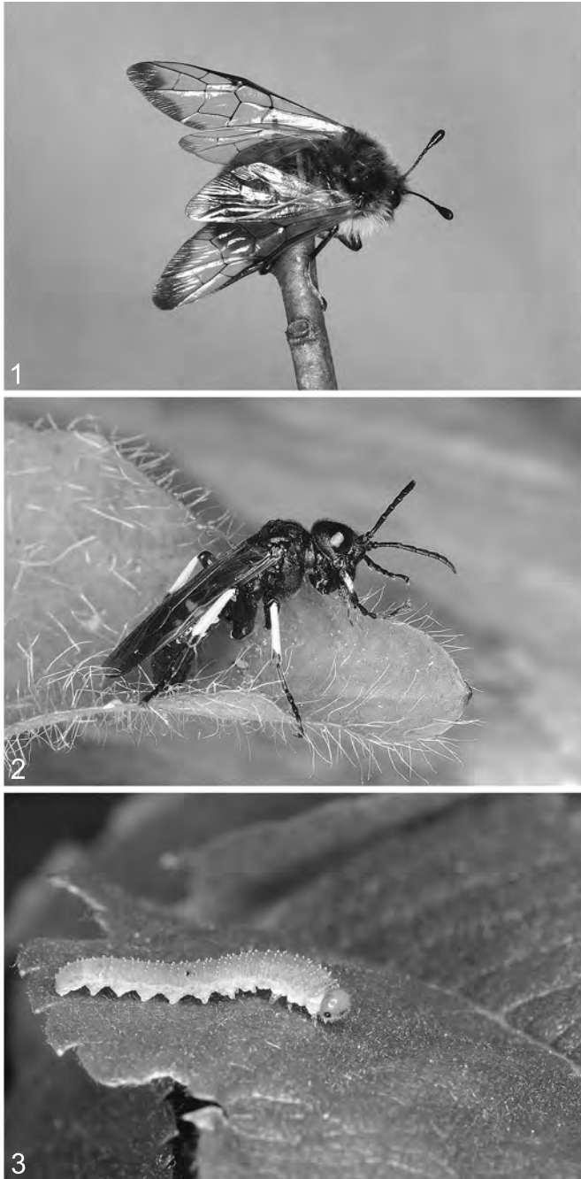
Abb. 1-3: (1) Trichiosoma lucorum (LINNAEUS) (Cimbicidae); (2) Tenthredo segmentaria FABRICIUS (Tenthredinidae); (3) Larve einer Tenthredinidae.