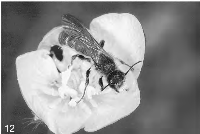
Abb. 10-12: (10) Andrena fulva (MÜLLER) (Apidae); (11) Sphecodes albilabris (FABRICIUS) (Apidae); (12) Chelostoma florissomme (LINNAEUS) (Apidae).