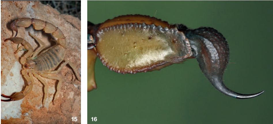
Abb. 15: Südlicher Todesskorpion ( Androctonus australis) aus Tunesien (Chenini). Dickschwanzskorpione (Buthidae) zeichnen sich durch einen breiten und kräftigen Schwanz sowie durch schmale, pinzettenartige Pedipalpen aus – bei dieser Merkmalskombination ist – unabhängig von der Größe und Färbung des Tieres – Vorsicht geboten! Abb. 16: Giftblase und Giftstachel von Androctonus australis. Die Aufnahme entstand für das Buch „Krank durch Arthropoden“. Der Skorpion wurde (vergeblich) elektrisch gereizt, um einen Gifftropfen abzugeben.