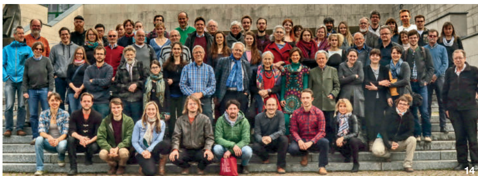
Abb. 12, Abb. 13, Abb. 14: Gruppenfotos von Tagungen der Österreichischen Entomologischen Gesellschaft 2016–2018. Fachgespräch am 22.10.2016 vor der Universität in Graz; Fachgespräch am 21.10.2017 vor der BOKU in Wien; Kolloquium am 17.3.2018 am Universitätscampus in Salzburg.