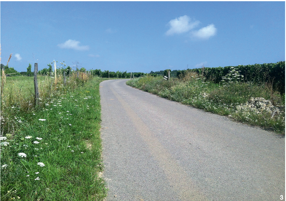
Abb. 2: Ein typischer Wegrand in Ritzing (Burgenland), umgeben von agrarisch genutzten Flächen (Wegrand R4, 29.08.2014). Abb. 3: Am Wegrand R6 waren entlang des rechten Straßenrandes Lesesteinhaufen aufgeschichtet (02.08.2014).