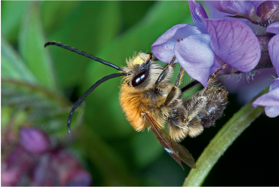
Abb. 6: Ein Männchen der Mai-Langhornbiene ( Eucera nigrescens ) beim Nektartrinken.

Dasygaster argentea oder die Schwarze Skabiosen-Sandbiene Andrena mucida (vgl. ZETTEL & WIESBAUER 2011) konnten im Untersuchungsgebiet jedoch noch nicht gefunden werden. Im Zuge des Projektes wurde A. marginata Ende August an den Wegrändern nachgewiesen, wo sie jeweils die Gelbe Skabiose zum Pollensammeln nutzte. Da A. marginata erst spät im Jahr von August bis September fliegt, ist es wichtig, die Wegränder erst Mitte September oder partiell zu mähen, damit die Biene ausreichend Skabiosen zur Verproviantierung ihrer Larven zur Verfügung hat.