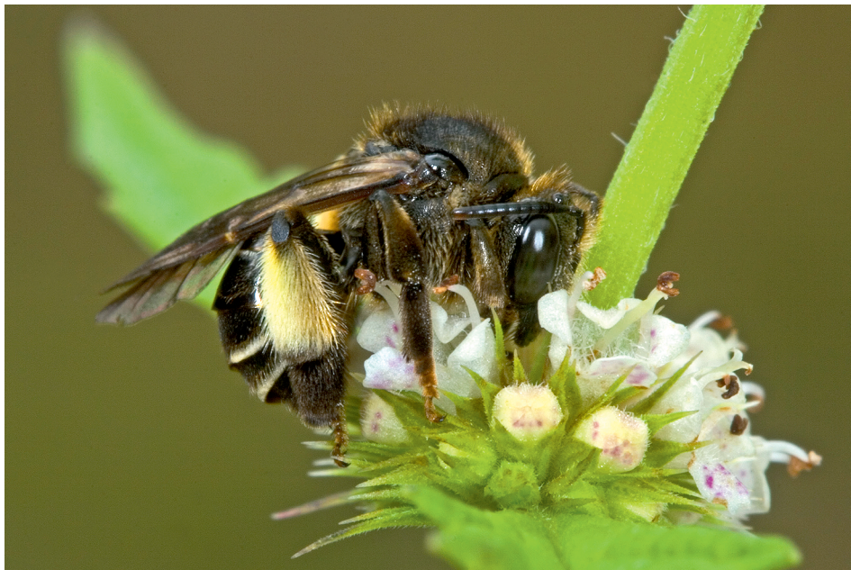
Abb. 7: Die Schenkelbiene Macropis europaea fliegt zur Nahrungsaufnahme unterschiedliche Pflanzen an.