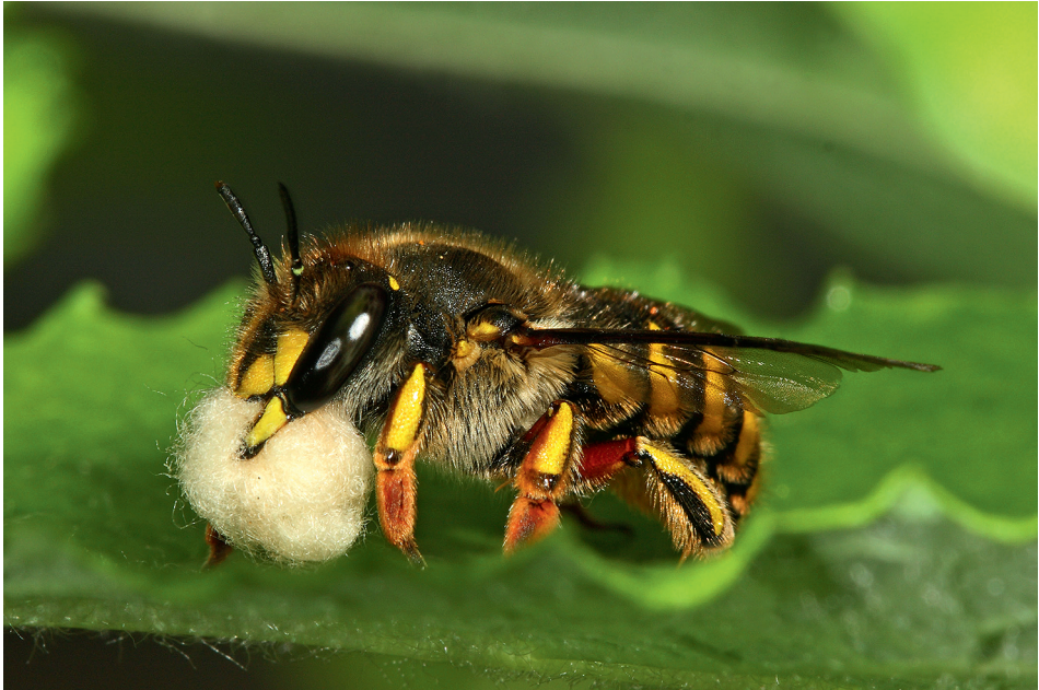
Abb. 5: Ein Weibchen der Garten-Wollbiene ( Anthidium manicatum ) mit abgeschabten Pflanzenhaaren zwischen ihren Oberkiefern.

Rapsanbau profitieren: Neben den Beobachtungen von WESTRICH (1990) und MAZZUCCO (1997) gelangen auch den Verfassern mehrere (unpublizierte) Nachweise sammelnder Weibchen auf Raps ( Brassica napus ). Auch in Ritzing wurden mehrere Männchen und Weibchen Ende April am Rande eines Rapsfeldes gefangen (R4). Es ist unklar, ob die rasante Ausbreitung dieser Art in Österreich nur auf den in den letzten Jahrzehnten verstärkten Rapsanbau oder auf die klimatischen Veränderungen zurückzuführen ist. Vermutlich spielt die Kombination beider Faktoren eine Rolle.