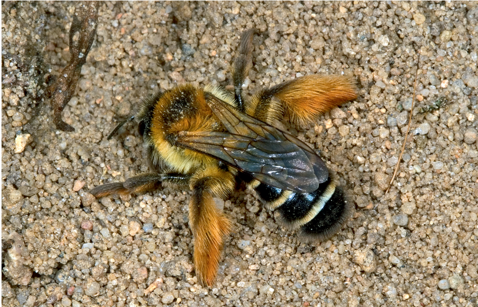
Abb. 8: Ein Weibchen der Braunbürstigen Hosenbiene ( Dasyglossa hirtipes ) beim Graben eines Nesteinganges.