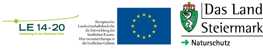
Abb. 4: Logos Förderprojekt.

Aufgrund des bisherigen Erfolges des Projekts und der Dringlichkeit zur Rettung der isolierten Populationen soll im Jahr 2017 das Projekt auf das gesamte potenzielle Verbreitungsgebiet der Art in der Steiermark (insbesondere Weststeiermark, Grenzmurgebiet, Oststeiermark) ausgedehnt werden.