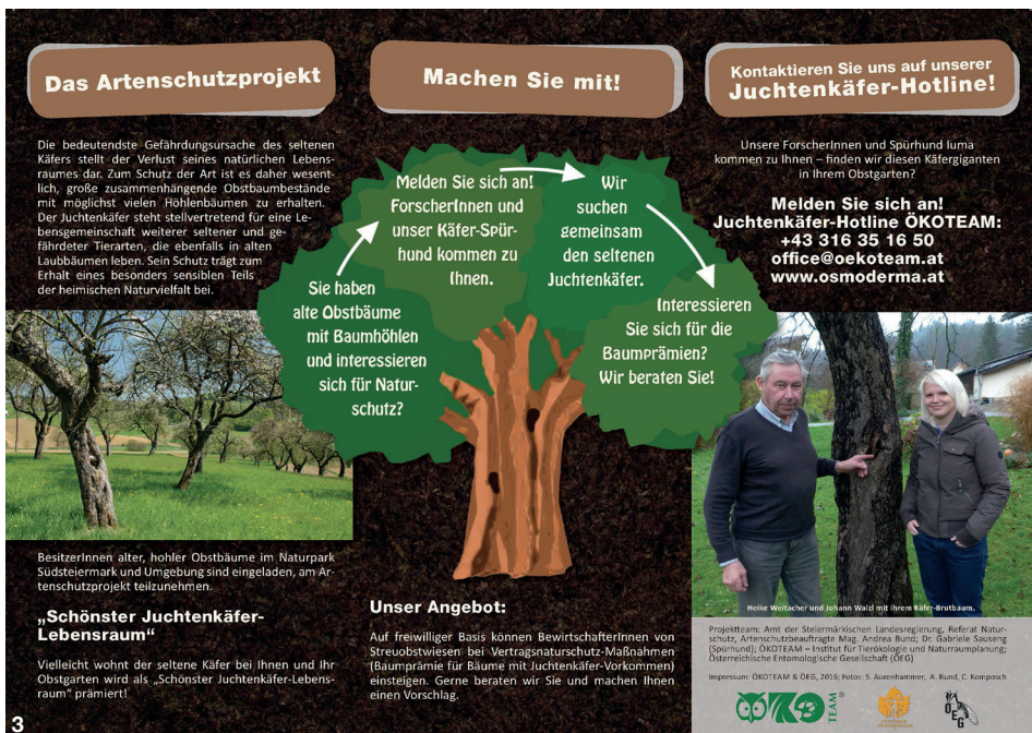
Abb. 2: Faltblatt Artenschutzprojekt Juchtenkäfer Steiermark, Vorderseite. Abb. 3: Faltblatt Artenschutzprojekt Juchtenkäfer Steiermark, Rückseite.