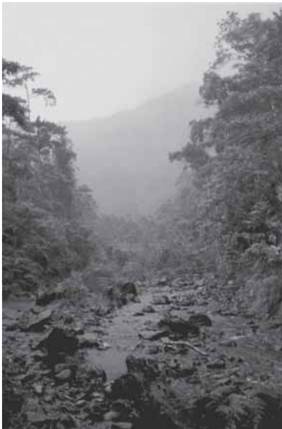
Abb. 3: Pawala River beim Lager Ga-ong.