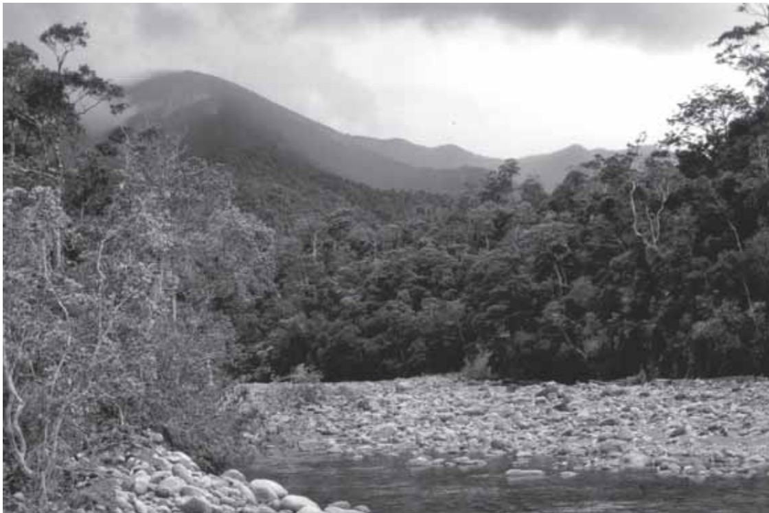
Abb. 2: Pawala River beim Lager Neu St.Gallen.