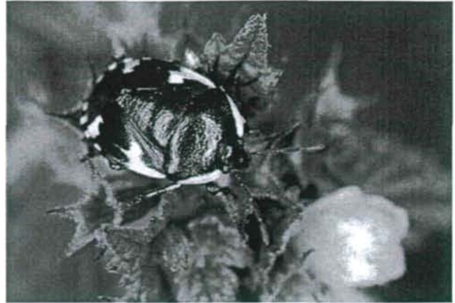
Abb. 2: Der Sechsfleck Tritomegas sexmaculatus lebt monophag an der Schwarznessel Ballota nigra . Im Rahmen dieser Untersuchung gelangen Zweitnachweis und Wiederfund (nach etwa 70 Jahren) für Kärnten.

Im Vergleich aller untersuchten Flächen zeigte sich, dass die meisten Gebiete mit 40 bis 44 festgestellten Heteropteren-Arten ein ähnlich hoch diverses Arteninventar besitzen. Zwei Brachen weisen höhere Individuenzahlen und gleichzeitig deutlich mehr Heteropteren-Spezies auf. Es sind die Gebiete „Metschach“, eine zwei-