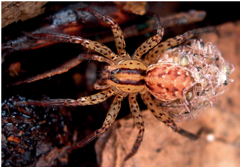
Abb. 5: Weibchen vom Trommelwolf, Hygrolycosa rubrofasciata , mit Jungspinnen am Kokon.

Weibchens und gleichzeitig vibriert der Hinterleib, wodurch ein klopfender, summender Ton erzeugt wird, was diesen Spinnen im Englischen den Namen „buzzing spiders“ eingebracht hat (HUBER 1995).