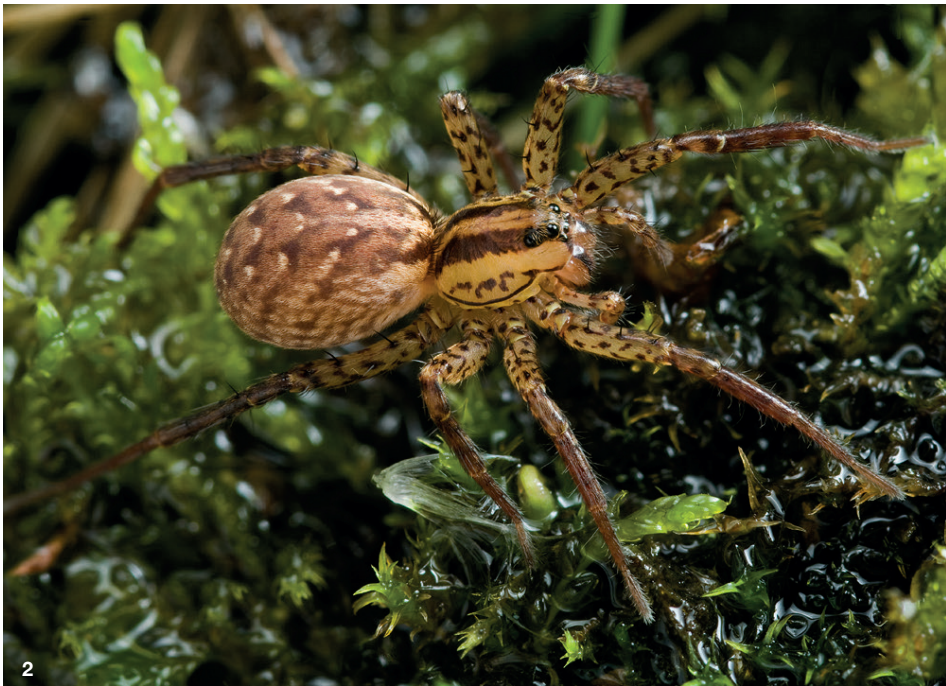
Habitus des Trommelwolfs, Hygrolycosa rubrofasciata . Abb. 1: Männchen. Abb. 2: Weibchen.