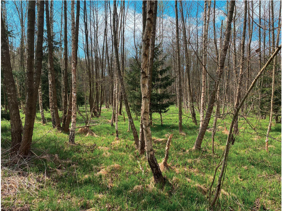
Abb. 3: Lebensraum des Trommelwolfs, Hygrolycosa rubrofasciata , am Beispiel eines feuchten, sehr grasigen, eher lichten Jungwaldes in Unterpremstätten, Steiermark.

Die Männchen sind fast schwarz, der Vorderkörper mit drei undeutlichen hellen Längsbinden, der Hinterkörper dunkelbraun-schwarz mit vier verbundenen Längsreihen weißer Punkte, die Beine zweifarbig, schwarz-hellbraun (Abb. 1). Die Weibchen haben einen hellbraunen Vorderkörper mit zwei dunklen bzw. drei hellen Längsbinden, des Weiteren zwei schmalere Fleckenreihen, und auch einen helleren Hinterkörper. Die Beine sind hellbraun mit dunklen Punkten (Abb. 2) (REICHHOLF & STEINBACH 1997, BELLMANN 2016, ARACHNOLOGISCHE GESELLSCHAFT e.V. 2021).