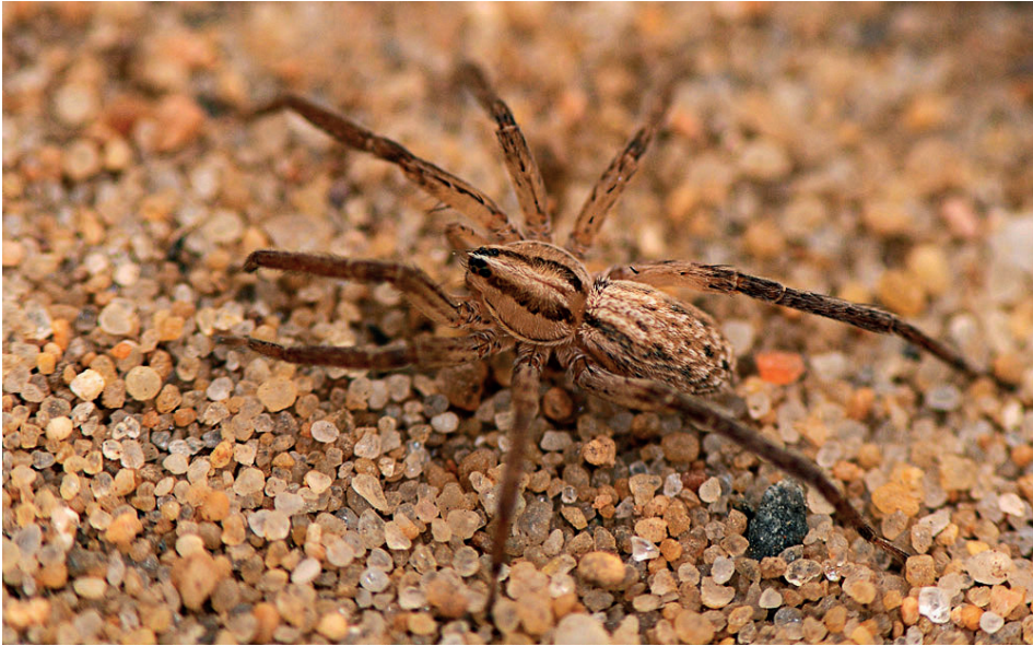
Abb. 6: Weibchen vom Gewöhnlichen Stachelbein, Zora spinimana .