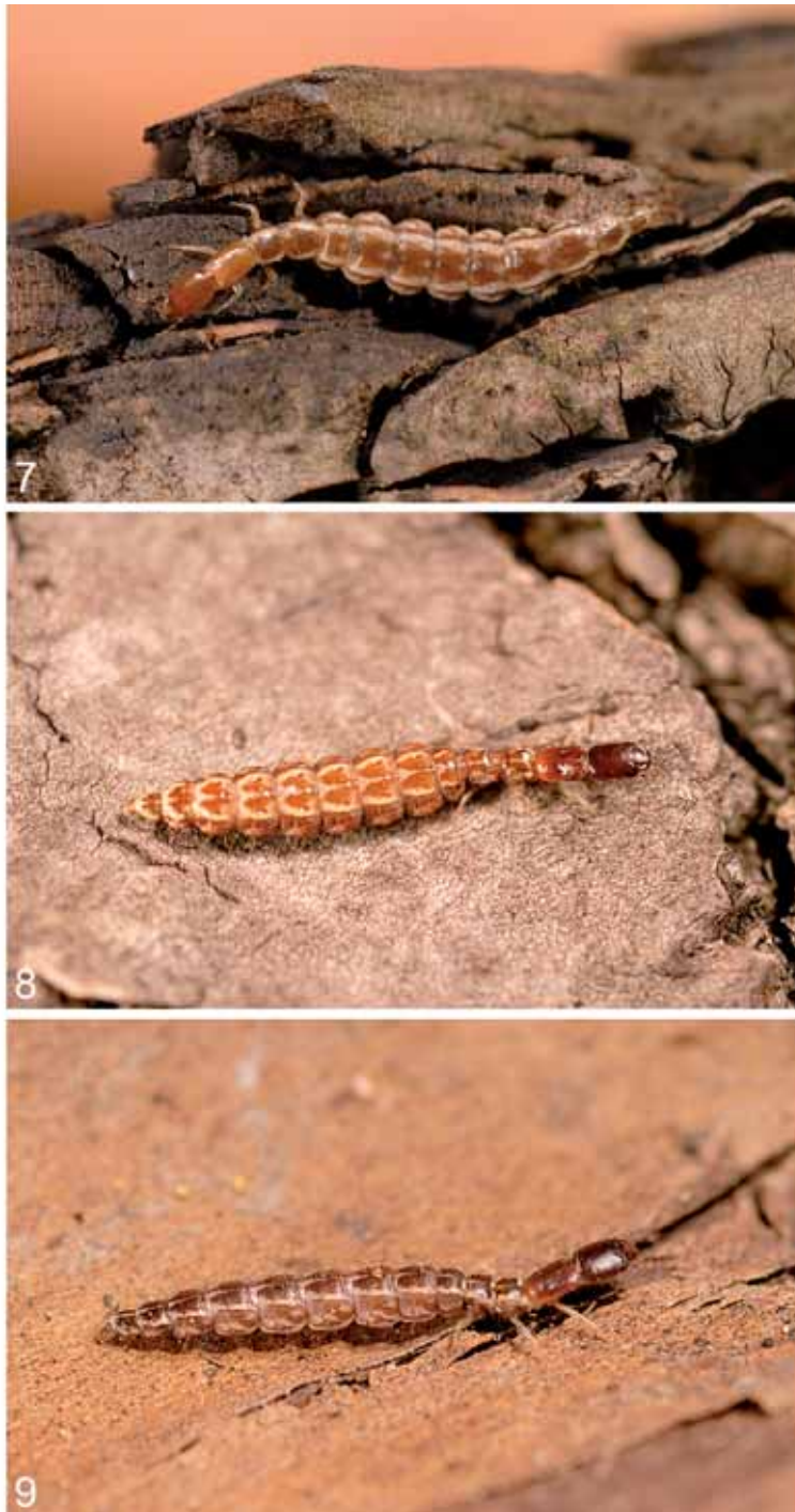
Abb. 7: Tjederiraphidia santuzza (H. A. & U. A. & RAUSCH). Erwachsene Larve. Italien, Kalabrien, Aspromonte, Montalto. Zucht ab ovo (2006). Foto P. Sehnal. – Man beachte das charakteristische dorsale und laterale Pigmentierungsmuster. (Länge ca. 12 mm).